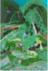
정주원 <녹색 언덕> 2022 캔버스에 백토, 한국화 물감 90.9 x 60.6 cm