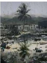
안경수 <야자수 모뉴먼트> 2023 캔버스에 아크릴릭 260 x 200 cm