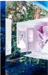
이지현 <파란 숲> 2016 캔버스에 유채 183 x 122 cm