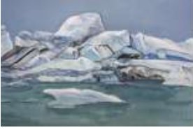
엄유정 <빙하> 2023 캔버스에 과슈, 아크릴릭 130 x 194 cm