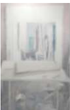
LIM Nosik Workroom 16 2023 Oil on canvas 200 x 130 cm