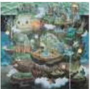
LIM Subeom The Golem Lives Everywhere

2022 Oil, pen, tempera on canvas 162 x 162 cm