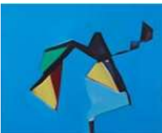
코헤이 야마다 <무제> 2023 캔버스에 유채 80.3 x 100 cm