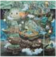
임수범 〈골렘은 어디서나 살아 있어〉 2023 캔버스에 아크릴릭 130.3x130.3cm