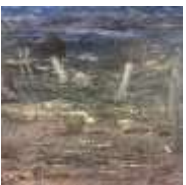
Yuki SAEGUSA Kukuzen "Tent"

2023 Oil on canvas 80.3 x 100 cm