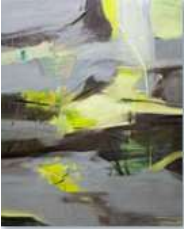
KOO Jiyeon Grey to Yellow 2023 Oil on linen 227.3 x 181 cm