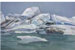
EOM Yujeong Glacier 2023 Gouache, acrylic on canvas 130 x 194 cm