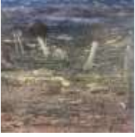
유키 사에구사 〈쿠쿠젠(栩栩然) "텐트"〉 2022 캔버스에 유채, 펜, 템페라 162 x 162 cm