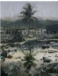
AN Gyungso Palm Tree Monument 2023 Acrylic on canvas 260 x 200 cm