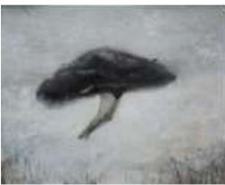
AHN Jisan Swimming in the Dark Cloud 2024 Oil on canvas 227.3 x 181.8 cm