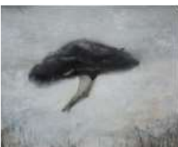
안지산 <유영> 2024 캔버스에 유채 227.3 x 181.8 cm

그림을 그리는 임노식 (b. 1989)의 몸은 일상의 장면들 속에 갇든 채다. 다만 그것을 바라보는 심리적 거리가 보통의 날들보다 가깝거나 멀다. 근작의 주제는 풍경을 감각하는 방식에 관한 질문이다. 물리적 장소의 속성을 소화해 내는 개인의 반응에 집중하는 면모다. <작업실>(2023) 연작은 서로 다른 시간에 바라본 작업대를 실물 크기에 가깝도록 그린 회화다. 안개 낀 듯 흐린 화면은 풍화된 기억의 생김새를 묘사한 결과다. 풍경과 캔버스, 자신 사이에 놓인 공기 층을 가시화하며 시공간의 거리 속 진동하는 세계의 모습을 포착하고자 하는 시도다.