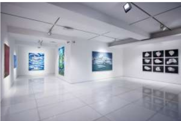
Installation view of ARARIO GALLERY SEOUL (3F)