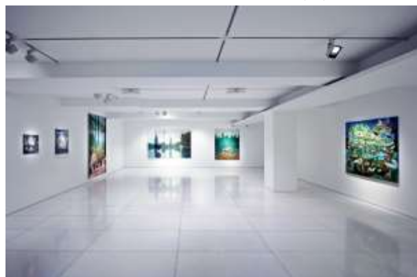
Installation view of ARARIO GALLERY SEOUL (4F)