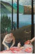
KANG Cheolgyu Hunting Note 2023 Oil on canvas 227 x 145.5 cm

matter. It reveals his attitude of perceiving the world as an organic network and recognizing oneself as part of such a whole.