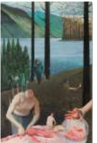
강철규 〈사냥일지〉 2023 캔버스에 유채 227 x 145.5 cm