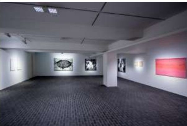
Installation view of ARARIO GALLERY SEOUL (B1F)