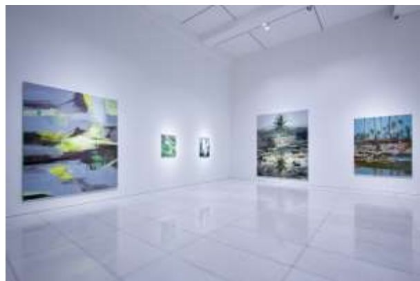
Installation view of ARARIO GALLERY SEOUL (1F)