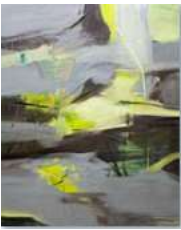
구지윤 <그레이 투 옐로우> 2023 리넨에 유채 227.3 x 181 cm